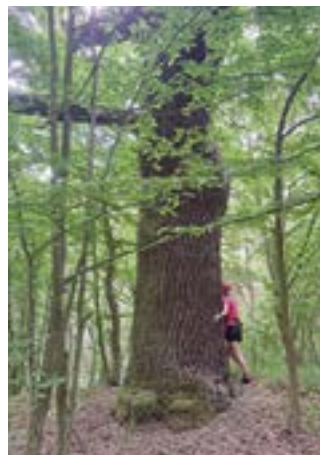
Dąb nr 29 na szlaku, 497cm obwodu, Dolina Lutyni