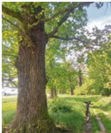
Dąb nr 14 na szlaku, 407 cm obwodu, Droga gruntowa z AŚDR do Annapola