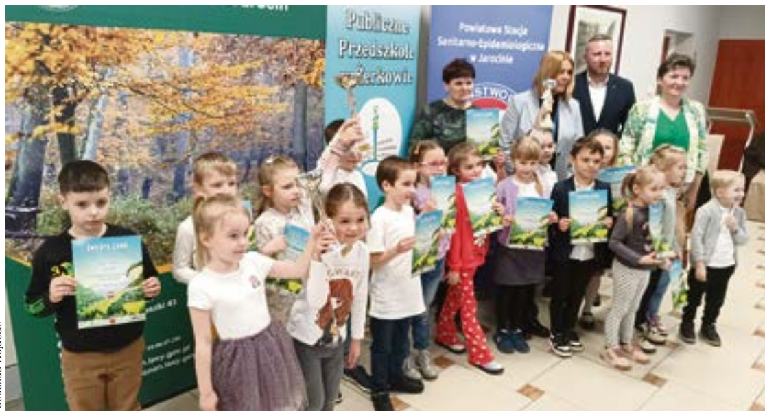
Uczestnicy konkursu z jury