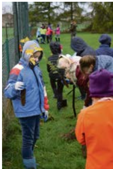
Prezentowanie mikorizy i symbiozy drzewa z grzybem ▶