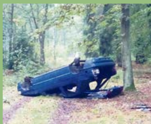
Samochód (ford escort) porzucony niedawno w leśnictwie Tarce

Las jest w tych dziwnych i trudnych czasach jednym z nielicznych miejsc, w którym póki co nie musimy nosić maseczek, przyłbic i innych uciążliwych covidowych atrybutów. Możemy i powinniśmy przystanąć, odetchnąć w nim pełną piersią, by zapomnieć na chwilę o trudach otaczającej rzeczywistości. Przyroda na pewno nagrodzi nas pięknymi obrazami. Bajecznie kolorowo przebarwiająca się liście klonów, grabów, dębów czy buków, nurkujący w taflę starorzeczka zimorodek, przechadzające się po łące żurawie. To wszystko plus kilka głębokich haustów świeżego, leśnego powietrza na pewno odsunie stres i doda energii. Za te nieocenione wartości należy się jednak naturze coś w zamian. To naprawdę nic takiego. Mianowicie szacunek objawiający się choćby w taki, niewymagający wielkiego wysiłku sposób, że jej nie zaśmieciemy, niszcząc często bezpowrotnie. Niby oczywiste, a jednak leśnicy Nadleśnictwa Jarocin przekonują się stale, że odwiedzającym lasy daleko jeszcze do doskonałości. Znajdując wśród drzew całe palety płyt eternitowych, beczki z niewiadomego pochodzenia chemikaliami, dziesiątki opon, lodówki, tapczany, a nawet porzucony samochód, rodzi się pytanie: co z ludźmi jest nie tak? Obyśmy za chwilę nie musieli spacerować po lesie wyłącznie w maseczkach, gumowych rękawiczkach i ciemnych okularach! Bo nie da się inaczej! Bo będzie to jeden wielki, niebezpieczny śmietnik!