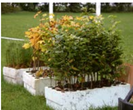
Młode sadzonki sosny, kłona i buka