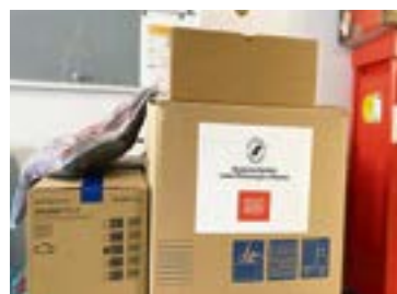
Przekazany nowy sprzęt

RDLP oraz lokalne Stowarzyszenie „Leśnicy dla Polski” sfinansują zakup urządzeń do dezynfekcji i sterylizacji, potrzebnych medykom i pacjentom szpitali zakaźnych w Tomaszowie Lubelskim i Puławach.