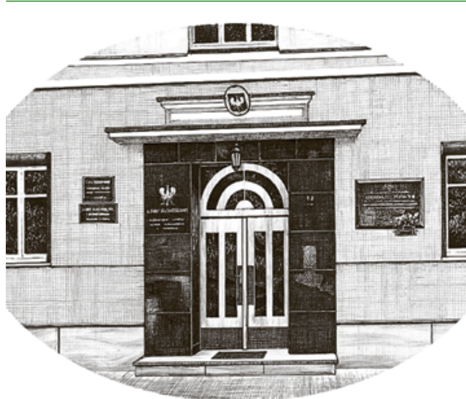
Szkic budynku RDLP w Poznaniu przy ul. Gajowej

Wisłą przez Tucholę i Chojnice do granicy polsko-niemieckiej, zwiększając jej powierzchnię do 375,6 tys. ha. Pod koniec dwudziestolecia międzywojennego, w 1938 r. nastąpiła jeszcze jedna zmiana granic dyrekcji, a dotyczyła tym razem lasów w całym kraju. Według nowego podziału administracyjnego poznańska dyrekcja została podzielona na 52 nadleśnictwa oraz 3 inne jednostki pozostające w zarządzie dyrekcji.