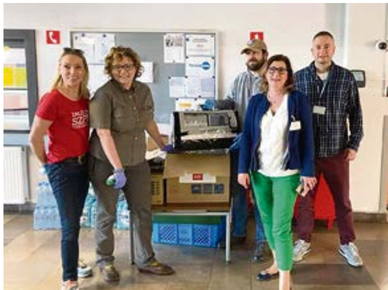
Pomoc z poznańskiej dyrekcji LP

ratowania zdrowia i życia. Polska służba zdrowia codziennie walczy o ludzkie życie. Dziękuję wszystkim, którzy włączają się w walkę z epidemią” – podkreśla minister środowiska Michał Woś. Udzielenie wsparcia finansowego przez jednostki organizacyjne Lasów Państwowych na zwalczanie epidemii możliwe jest bez rezygnacji z realizacji zadań w zakresie gospodarki leśnej.