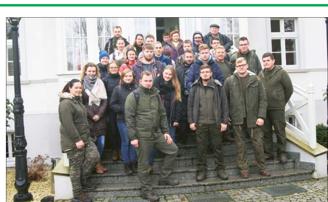
Pamiątkowe zdjęcie studentów uczelni poznańskiej przed OEL w Czeszewie