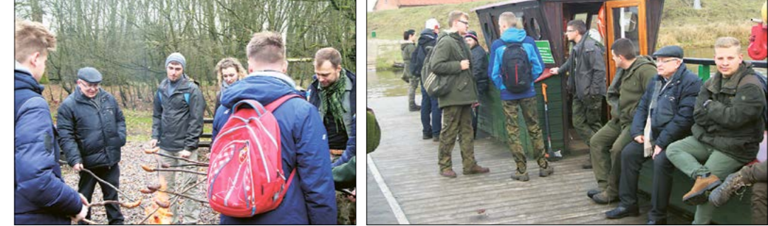
Krótką przerwę na posiłek. Przeprawa promowa studentów